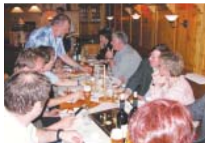
Das Ländle trumpft mit Schanklizenz: Politik geht auch durch die Kehle

Der neue Geltungsdrang der Länder zeugt von einem gewachsenen Selbstbewusstsein, was sich auch in gesteigertem Medieninteresse niederschlägt. In letzter Zeit berichteten selbst auflagenstarke Medien über den steigenden Einfluss der Repräsentanzen in Brüssel. Diesen Platz haben sich die Landesvertretungen über Jahrzehnte erkämpft. Denn offiziell formuliert allein die Ständige Vertretung der Bundesrepublik die deutsche Position in Brüssel. Die Länder haben, anders als im Bund, keinen unmittelbaren Einfluss auf die Gesetzgebung. „Formal gesehen sind wir hier niemand“, sagt einer der Vertreter überspitzt. Aber es gibt Achtungserfolge: Für die Zustimmung zum Maastrichter Vertrag erkaufte sich die Bundesländer im Grundgesetz Kompetenzen für Brüssel. Auch die EU achtet